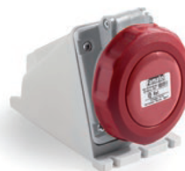
Ref. / Item 24391