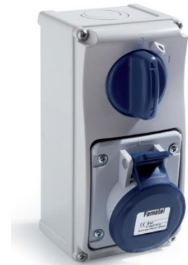
Ref. / Item 26008