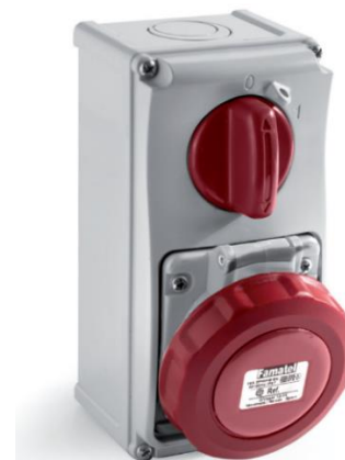
Ref. / Item 26002