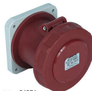
Ref. / Item 24374