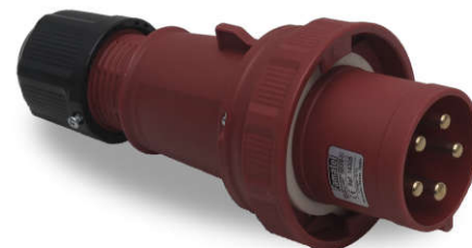
Ref. / Item 14305